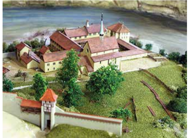
So war die Lage des Klosters, bevor die Saane durch die Staumauern des Pérolles-Sees gebändigt wurde. Bildquelle: Maquette Frima 1606 – Auszug aus dem Martini-Plan.

Die Pfarrei Tafers (die damals noch die heutigen Pfarreien St. Ursen, Alterswil, St. Antoni und Tafers umfasste und bis in die Unterstadt reichte) ist seit 770 Jahren mit diesem besonderen Frauenkloster verbunden.